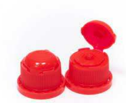
Tappo con licenza UTF

Tappo di sicurezza a vite con sigillo autobloccante e coperchio richiudibile. Apertura tramite schiacciamento di entrambi i lati del tappo e sollevando il cappuccio. Tagliare successivamente la linguetta presente sotto al coperchio per l'utilizzo. Tenere durante l'apertura sempre la bottiglia in posizione diritta. Manipolare ed aprire la bottiglia senza comprimerla con attenzione e cautela.