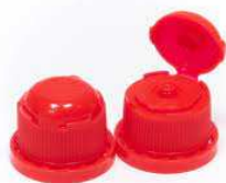
Tappo con licenza UTF

P501: Smaltire il contenuto/recipiente nel rispetto della normativa vigente.